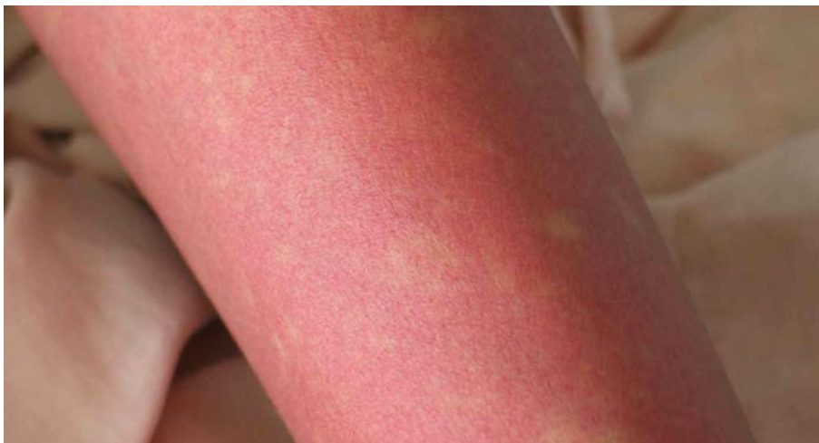
図 2. デング熱患者の発疹：解熱時期にみられた島状に白く抜ける紅斑