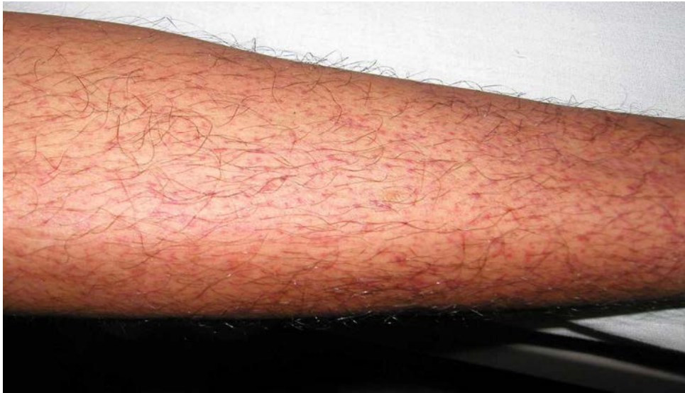
図 1. デング熱患者の発疹：解熱時期にみられた点状出血