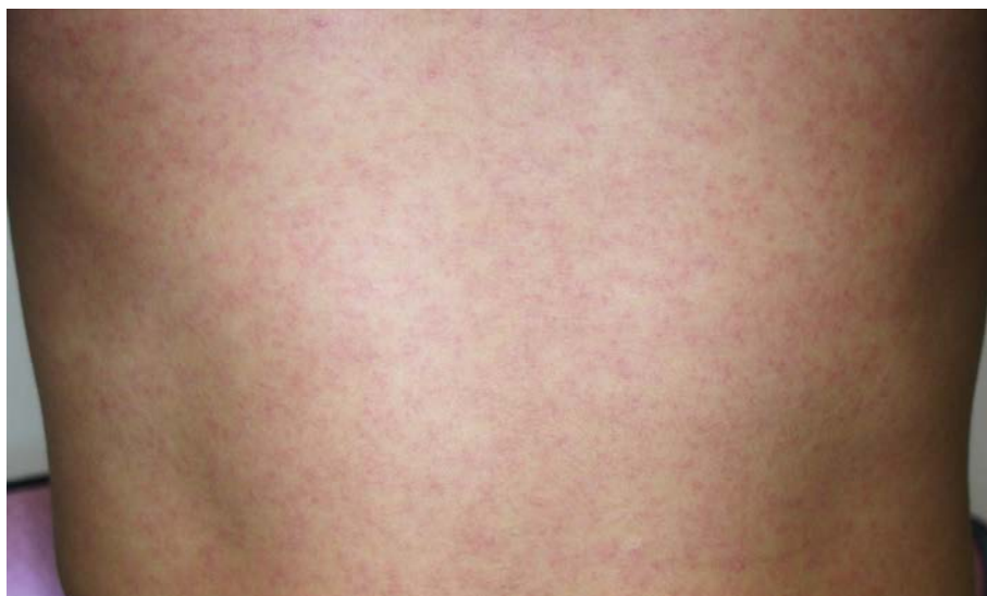
図3. ジカウイルス病の斑状丘疹様の発疹

潜伏期間は、2～12日（多くは2～7日）である。ジカウイルス病の臨床症状は多彩であるが、斑状丘疹様の発疹（ 図3 ）は90～100%に認められるのに対して、発熱の頻度は35～65%とされている 25,45,46 。また発疹は掻痒感を伴うことが多いとされている。また、大半の症例は入院を必要としなかった。 表7 に2015年のブラジル・リオデジャネイロにおけるジカウイルス病患者が発症後4日以内に認めた臨床症状を示す 45 。