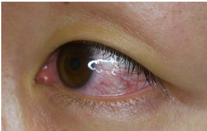
図4. ジカウイルス病の充血性結膜炎